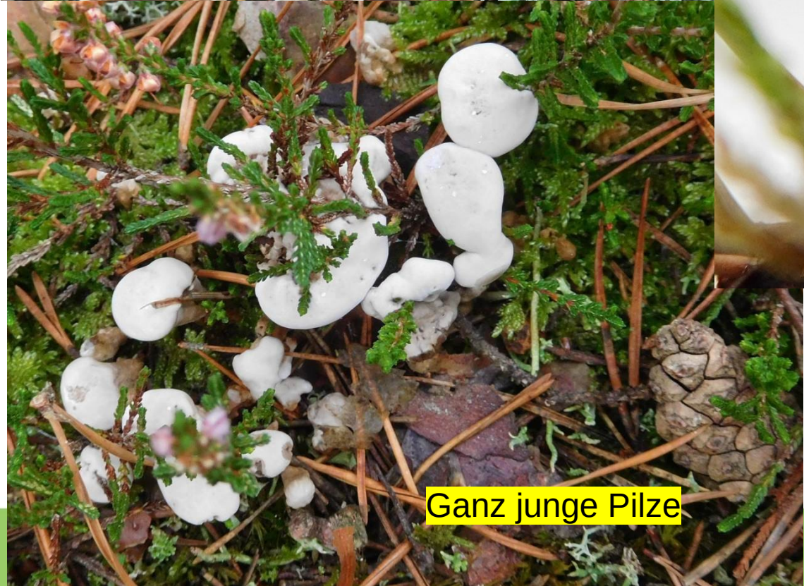
Ganz junge Pilze