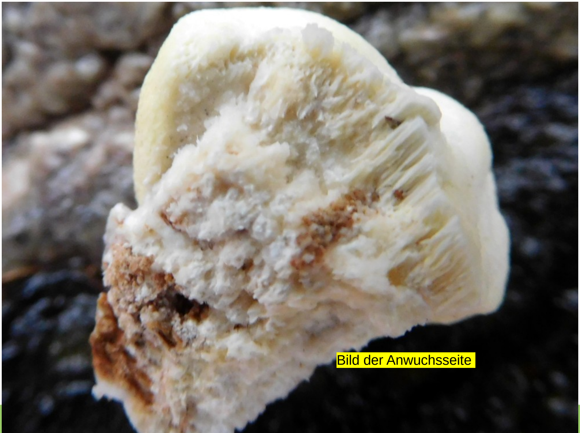
Bild der Anwuchsseite