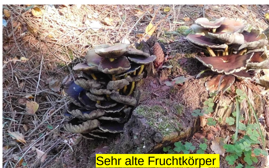
Sehr alte Fruchtkörper