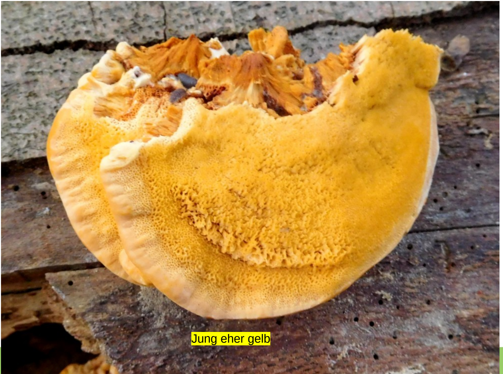
Jung eher gelb