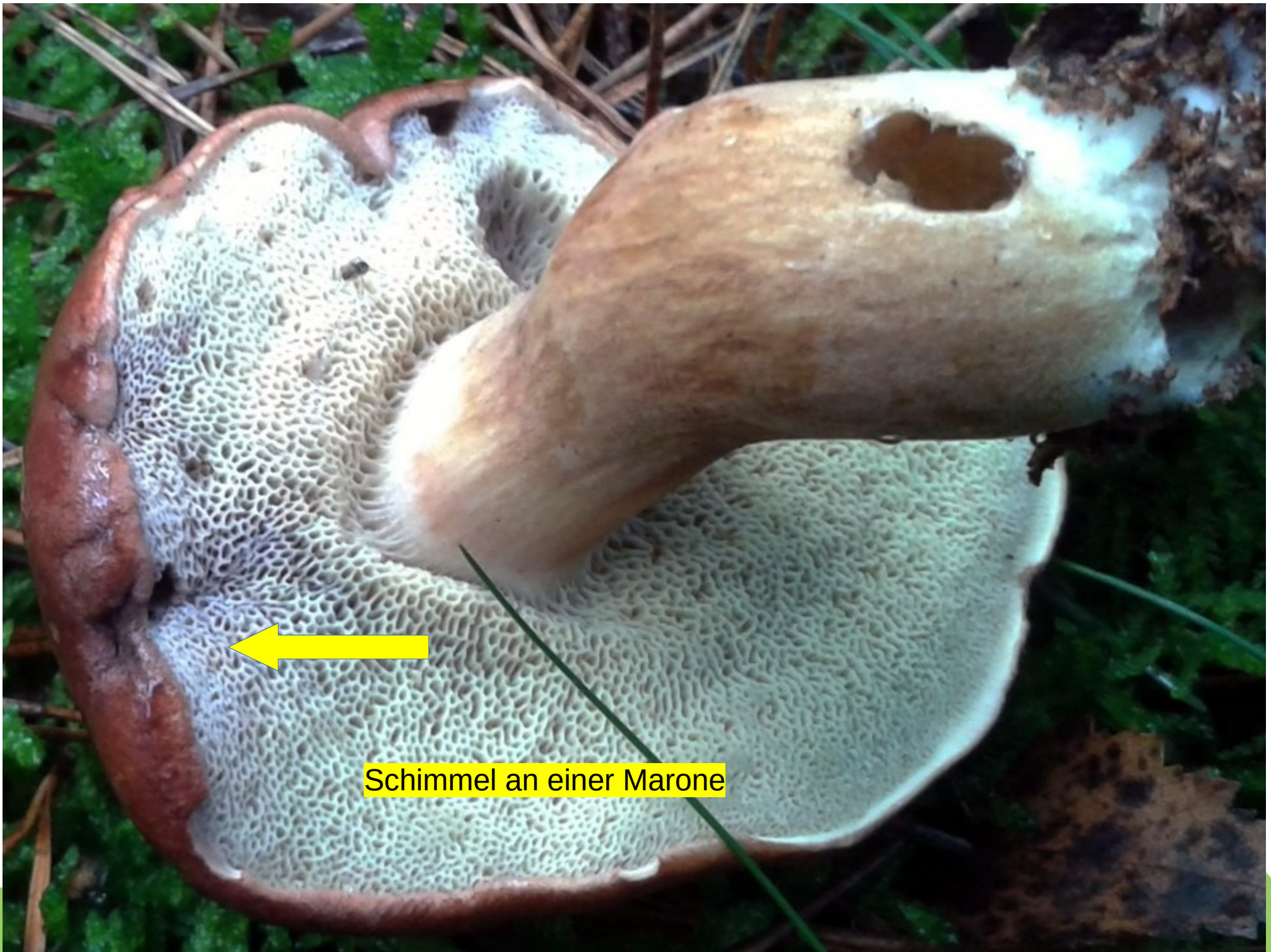
Schimmel an einer Marone