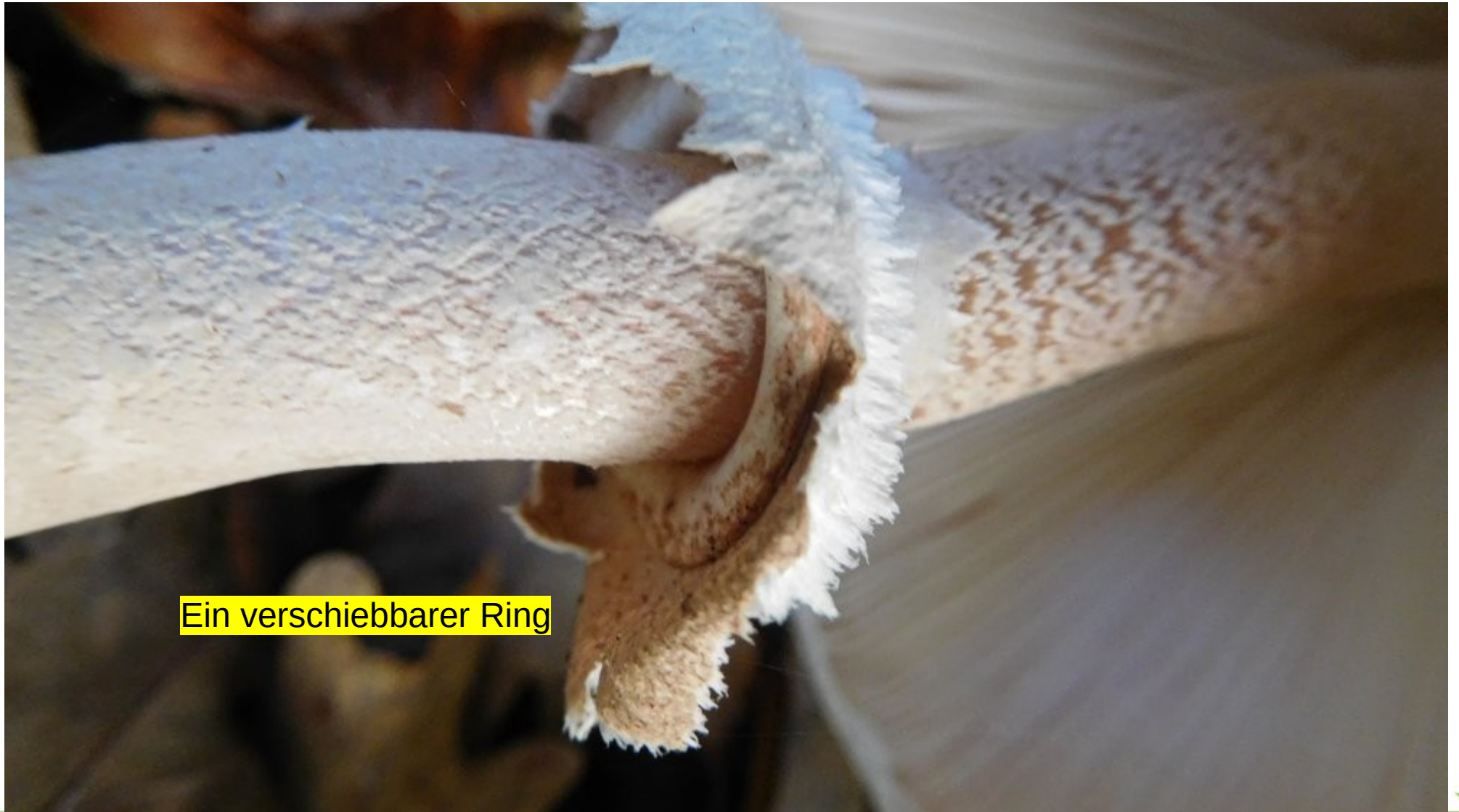
Ein verschiebbarer Ring